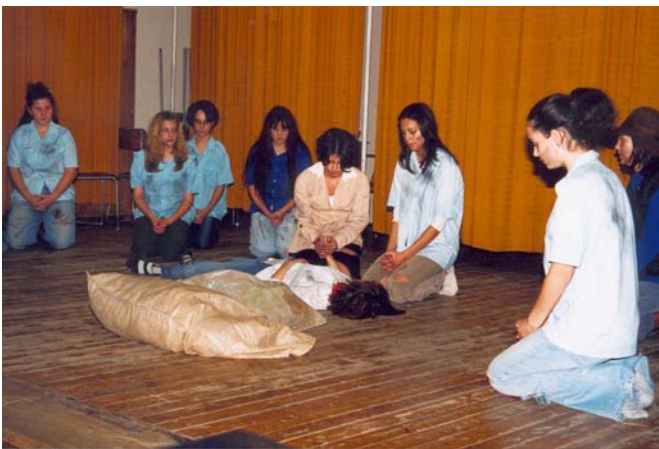
9. E osztály