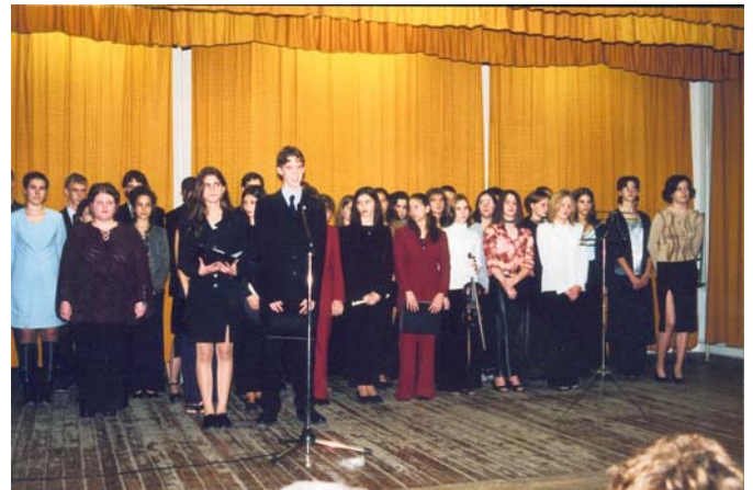
9. B osztály