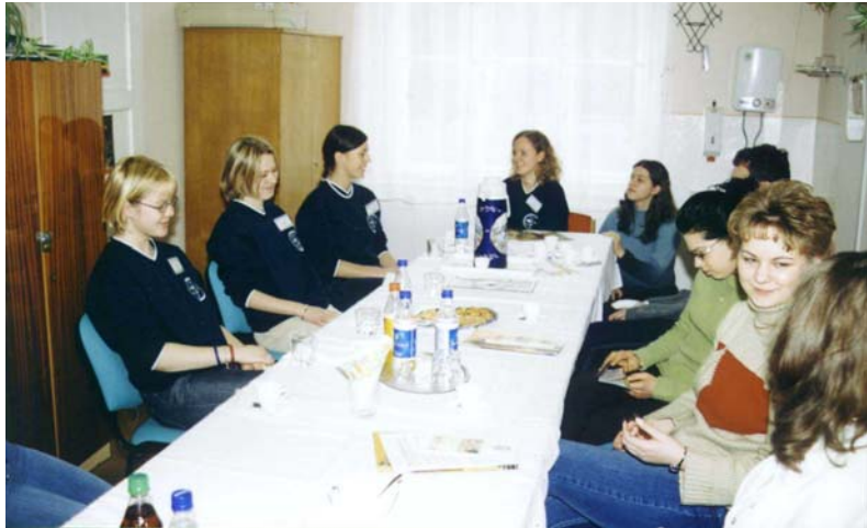
A találkozás első pillanatai a diákoknál