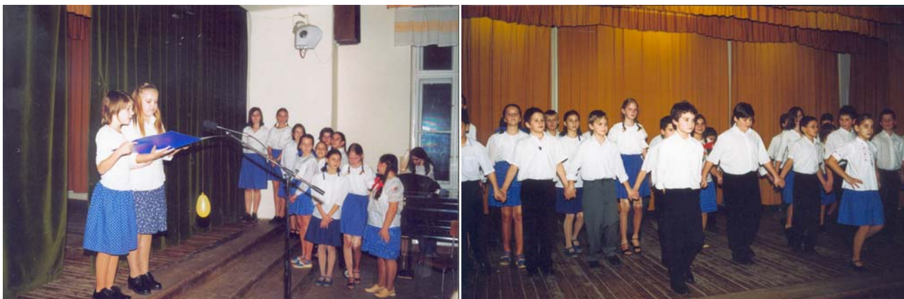
5. C osztály

Az 5. C-sek műsorával kezdődött az előadás. Majd abc sorrendben következtek az egyes osztályok