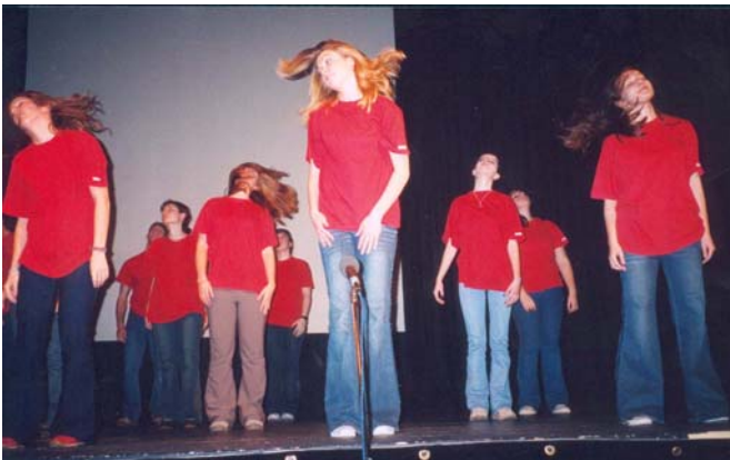
12. B osztály