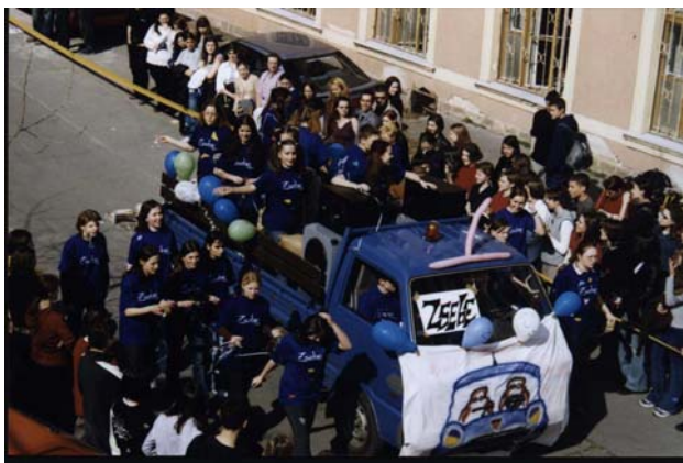
S végül megjött a „Zsebeteam” és