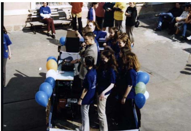
Ő, a legnagyobb menő.