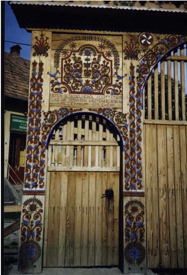
A vendégváro kapu.....