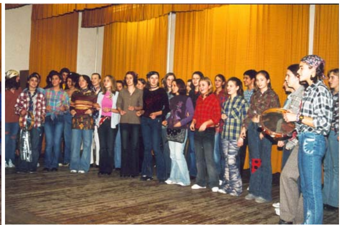
9. K osztály

Az osztályok műsorai után a tanulók a tornateremben megrendezett „ismerkedési bálon” szórakozhattak és ismerkedhetek egymással. A felsőbb éves tanulókból ebben az évben is nagyon kevesen vettek részt ezen a rendezvényen, de ez nem rontotta a megjelent diákok hangulatát.