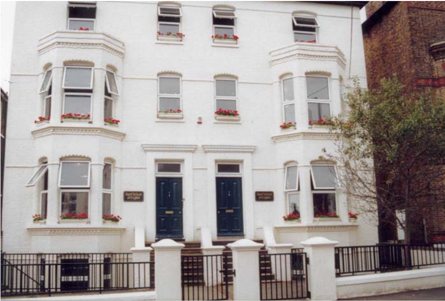
A broadstairs-i iskola épülete

ri"-típusú házigazdák.) Bár Broadstairsben is voltak olyanok, akik keveset törődtek néhányunkkal, elmondhatjuk, hogy mindenki sokat tanult a családjától. A körülményeink változatosak voltak, a praktikus egyszerűségtől a nálunk luxusnak számítóig. Külön örömeinkre szolgált, ha a családok gyerekeivel vagy más nemzetiségű vendéglátóival is beszélgethettünk. Sok barátság született ezekből a találkozásokból.