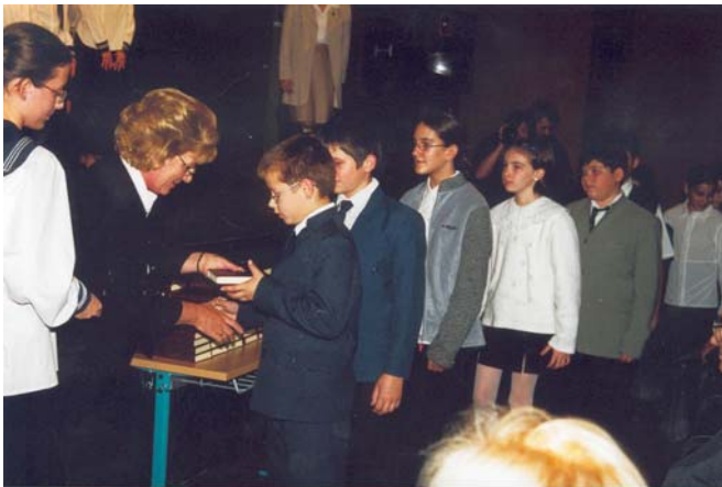
Az ünnepélyes kézfogásra 33 ötödikes

Ezen kívül megkapjátok az iskola jelvényét, amelyet mi, tanárok és az idősebb diákok is büszkén viselünk. Ez a jelvény, a ciszterci diákok jelvénye egy nagy közösséghez, a nyolcszáz diákhoz való tartozás érzését jelenti, de jelenti a kilencszáz éves értékrendhez való ragaszkodást, az értékrend tiszteletét és megtartását. Fogadjátok tőlünk szeretettel ezeket az ajándékokat, ezeket az útravalókat! És most arra kérek benneteket, hogy egyenként gyertek ki az ünnepélyes kézfogásra!