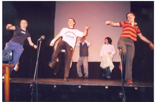
12. C osztály