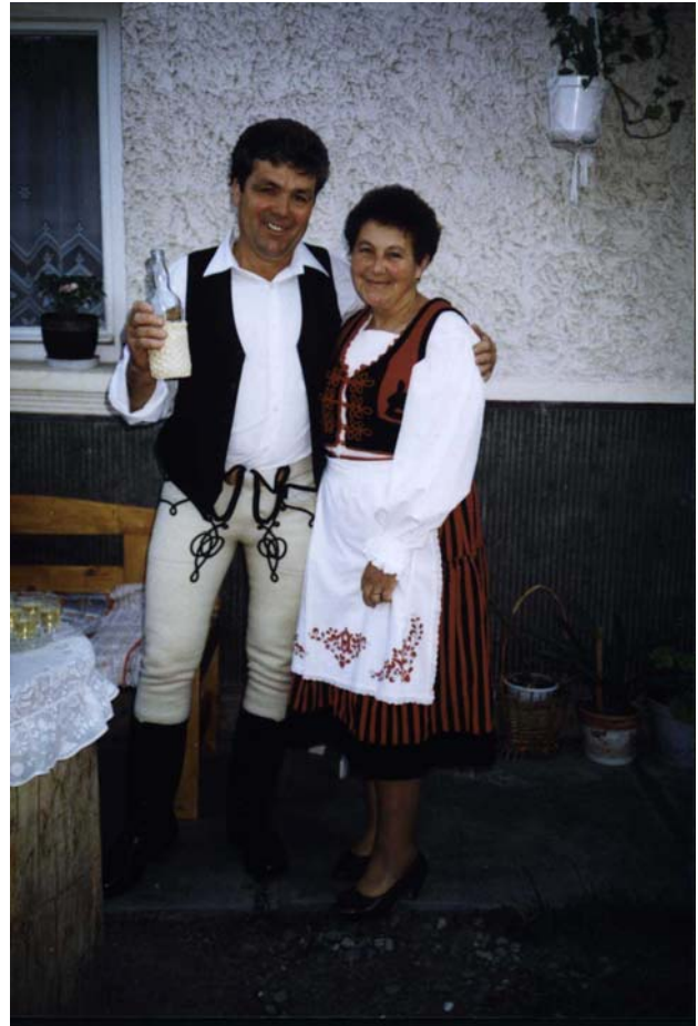
és a vendégeket fogadó házaspár