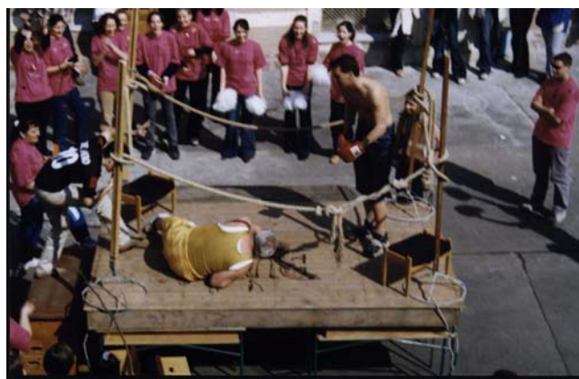
és legyőzi ellenfelét ...