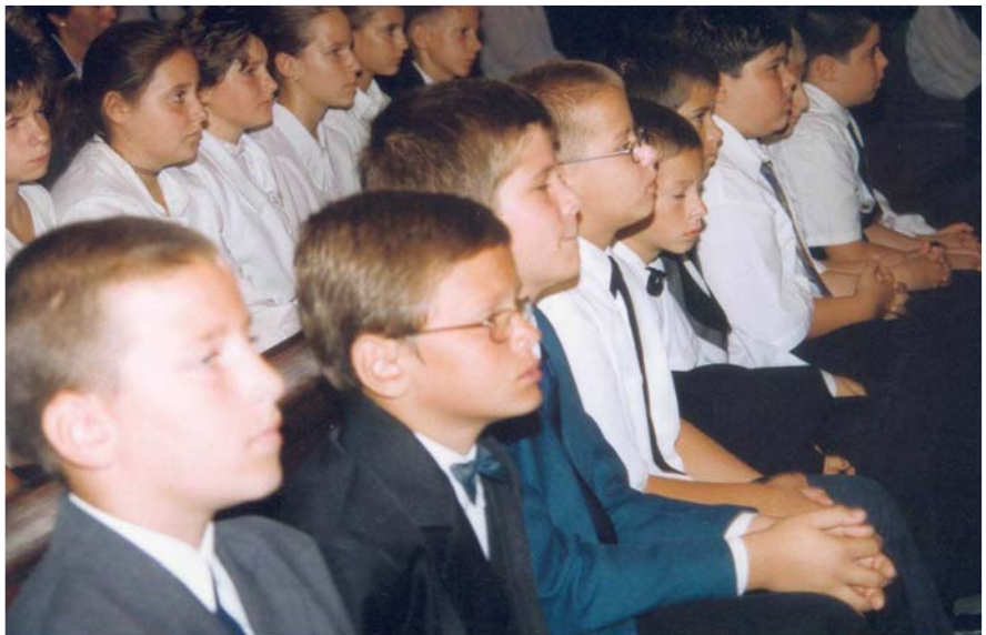
Iskolánk új polgárai a Veni Sanctén

Tudjuk és merjük vállalni hitünket, mert tudatában vagyunk annak, hogy magyar és keresztény múltunk van. Amit teszünk, azt a hazában ezer év óta tesszük. Krisztus óta pedig kétezer éve ezt az utat járják az emberek. Ezen az úton kell most tovább mennünk. Nekünk, valamennyiünknek. Ezen az úton kell hazát, embert és Istent szolgálunk tanulással és tanítással egyaránt. Legyen ezen az úton erőnk, kitartásunk és hitünk ebben a tanévben