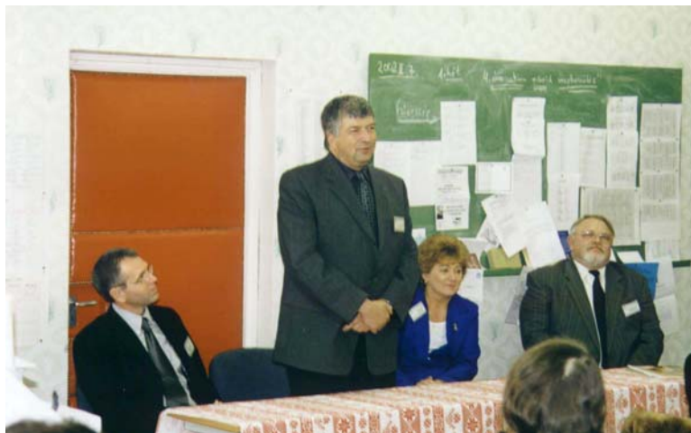
A találkozás első pillanatai a tanárban