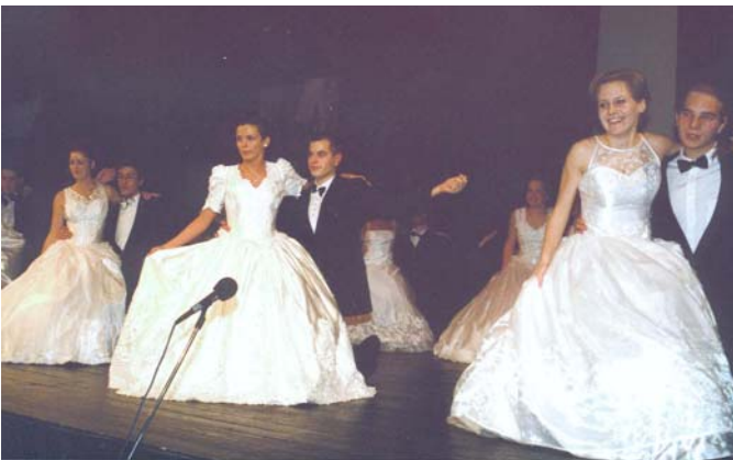
12. D osztály