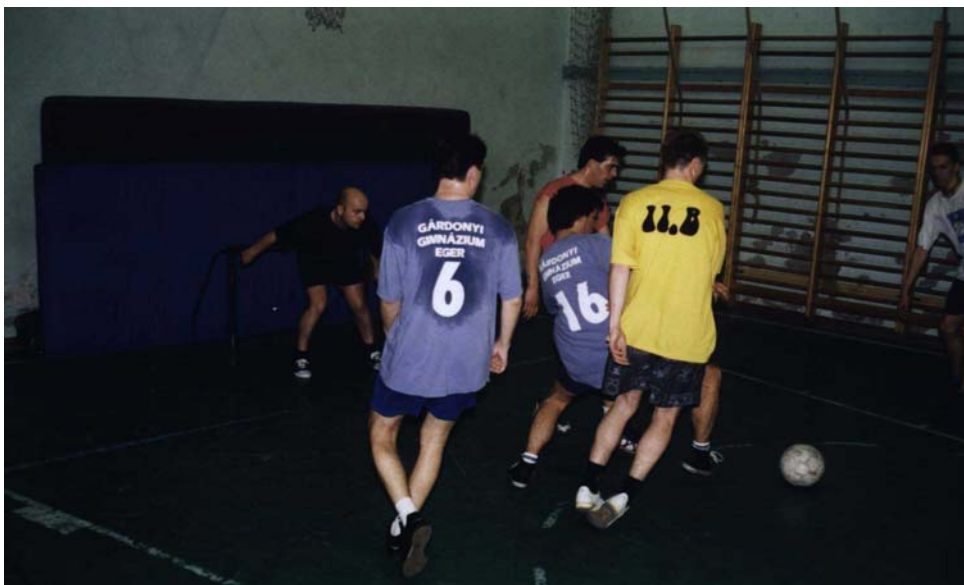
Görcsösen támadnak a diákok

Nagy érdeklődéssel várták a diákok is, a tanárok is a tanár-diák focimeccset. A diákok edzéséről nem szivárgott ki semmi, teljes volt a hírzárlat; míg a tanárok rendszeresen edzettek hétfőnként, majd „taktikai megbeszéléseket” is tartottak. A tavalyi vesztes csapat teljesen kicserélődött (ők voltak a diákok), de a korábban győztes tanári csapatban is végrehajtották a szükséges frissítést és fiatalítást.