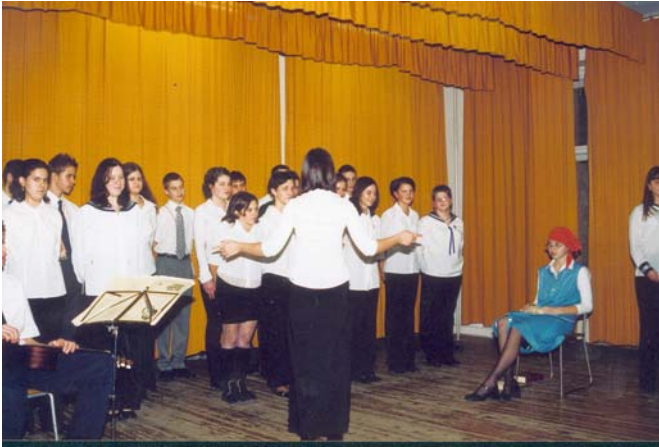
9. A osztály