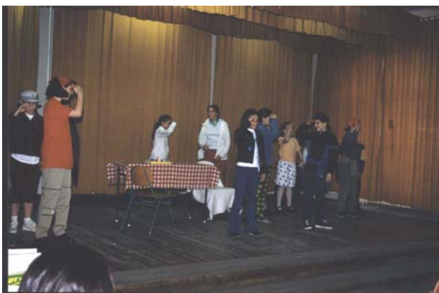
„The Lost Lamp” egy jelenete,

A diáknapi művészeti bemutatón ebben az évben is színvonalas műsorszámot hallgathattak meg az érdeklődők. Bár az idén kevesebben jelentkezték, mint a tavalyi évben. Öröndetes viszont, hogy az 5. C osztály tanulói közül sokan szerepeltek. A felkészülés és az előadás izgalma a versenyzők számára bizonyára sokáig emlékezetes marad. A nézők a szereplő diájkaink tehetségéről, felkészültségéről győződhetnek meg. Természetesen nehéz dolga volt a zsűrinek az értékelésnél. Az alábbi műsorokban a következő helyezések születtek: