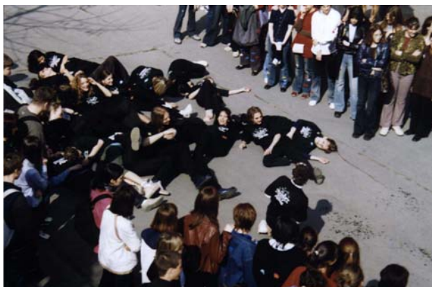
Megjelentek a vámpírok.