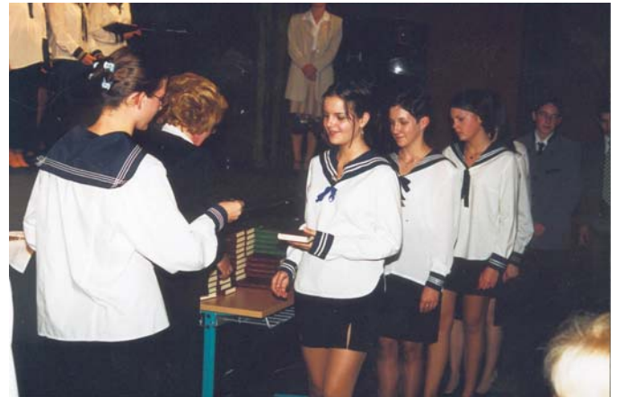
és 159 kilencedikes tanuló vonult fel