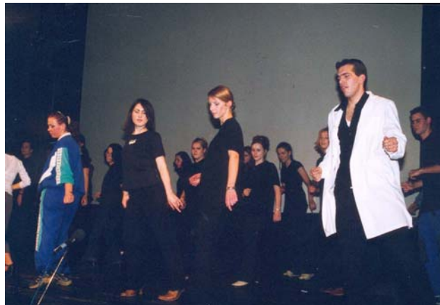
12. D osztály