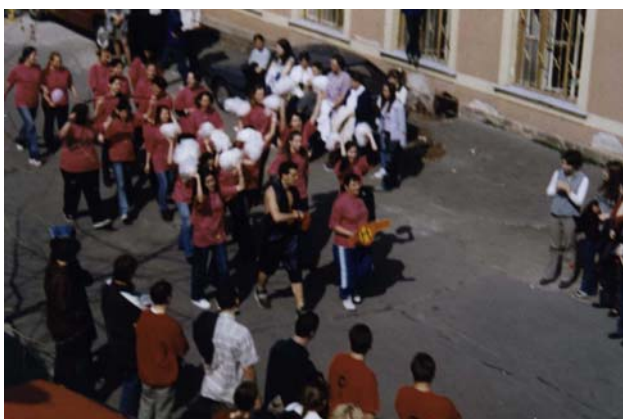
Bevonul a kihívó Bajnok....

A két és félnap minden programján nem tudtam ott lenni, de amerre jártam, fényképeztem. Ezekből a fényképekből válogattam egy csokorra valót.