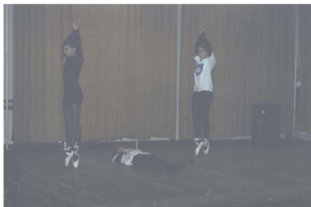
és egy mozdulat „A táncos halála”-ból.