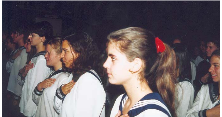
Esküsznek a lányok

Én, ... a Gárdonyi Géza Ciszterci Gimnázium és Szakközépiskola rendjét mindenben megtartom, az iskola keresztény, katolikus értékrendjét elfogadom, és ennek szellemében élek. Szüleimet, tanárait, az iskola dolgozóit, diáktársaimat tisztelem, rájuk szegyet nem hozok. Szorgalmasan tanulok, képességeimmel mindenkor a tudás megszerzésére törek-szem. A Ciszterci Rend és az Egyház hagyományaihoz és hazánkhoz mindenkor hű leszek. Isten engem úgy segítjen!